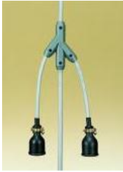
Y2A2 Y2A3 Y2A3E Y6A5E Y6A8E