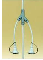
MY2A3E (コネクタ一部 ビニール一体 成型品)