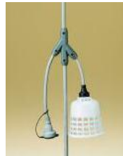
MY2B3E (コネクタ一部 ビニール一体 成型品)