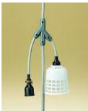
Y2B2 Y2B3 Y2B3E Y6B5E Y6B8E