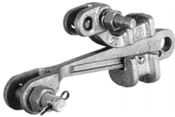
銅線用引留クランプ懸垂碍子用