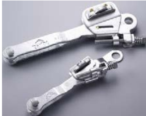
中電 引留クランプ