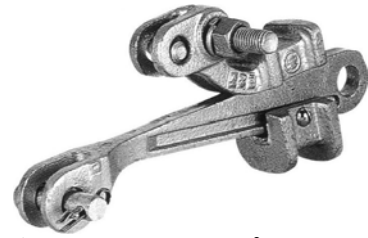
銅線用引留クランプ