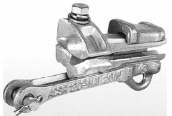
アルミ線用引留クランプⅡ型