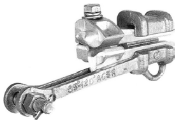
アルミ線用引留クランプ懸垂碍子用