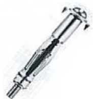
石膏ボード、中空壁用